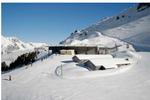
Bild 03 Mittelstation