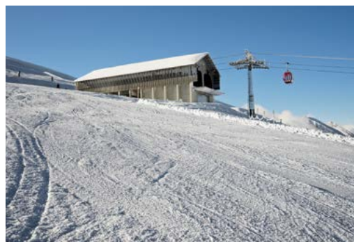
Bild 02 Bergstation