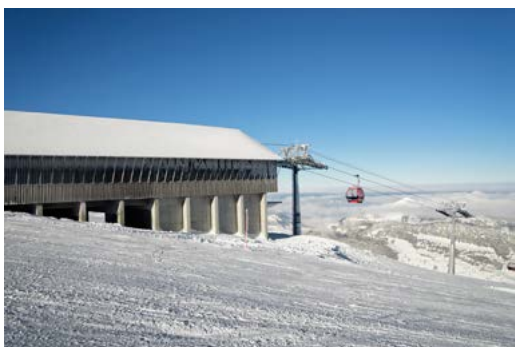
Bild 01 Bergstation

Download unter: www.chaeserrugg.ch/de/startseite/winter/service/medien/pressemitteilungen.html