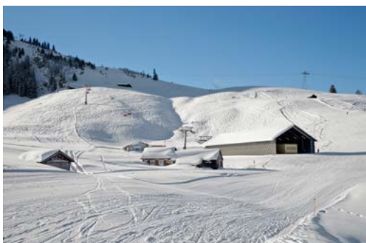
Bild 05 Talstation