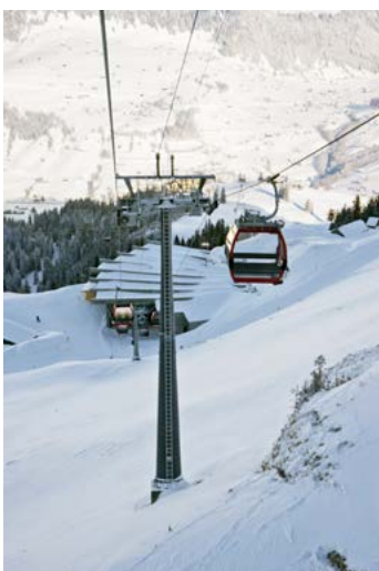
Bild 07 Blick auf Mittelstation