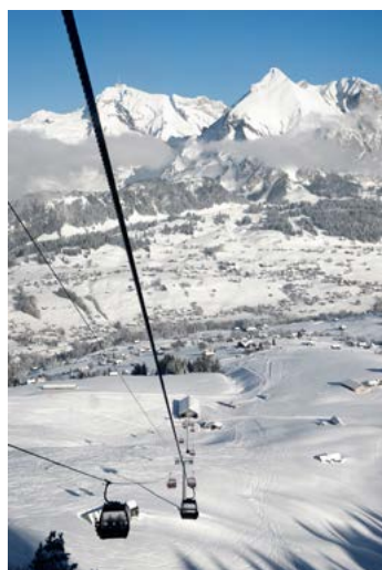
Bild 08 Blick auf Talstation