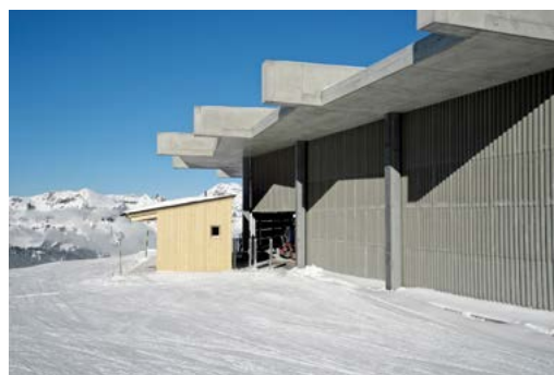
Bild 04 Mittelstation